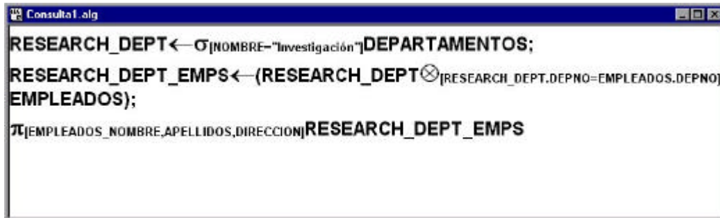
Figura 4. Ventana de edición